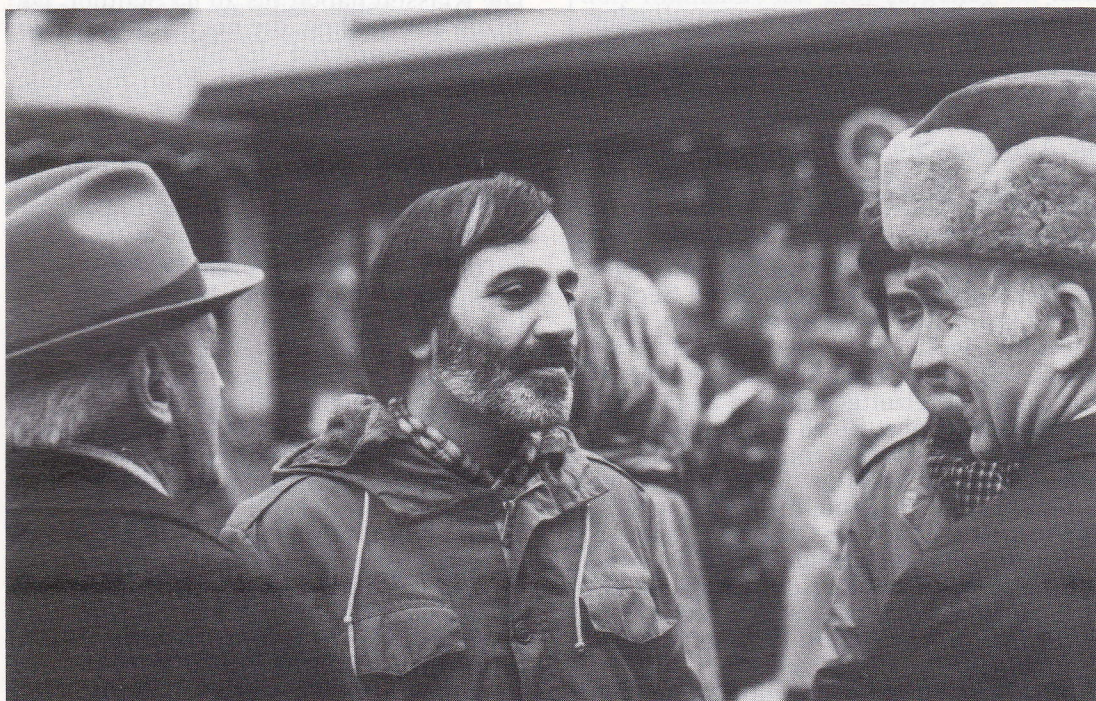
Am Iambi-Stand in der Fußgängerzone

as schließt die Klassen und erhebt die Hand in der nicht so schnell seine Hand wenn er nicht so schnell das Spiel und die Bewegung die Klassen für die Schüler Wieder durch die Hände eine der besten Informationen Schüler aus und soll die Hilfe Information